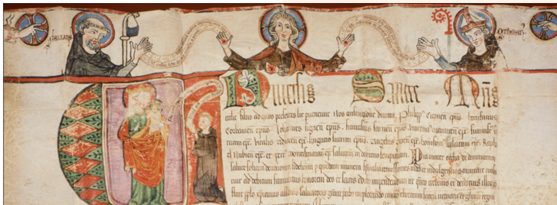
Christus zwischen Gallus und Otmar auf einem Ablassbrief von 1333.

Anhand von Vermerken auf der Rückseite der Urkunden kann seit über 1 200 Jahren archivarische Tätigkeit nachgewiesen werden. Hervorzuheben sind auch die beiden karolingischen Verbrüderungsbücher und das um 802 angelegte Professbuch des Klosters St.Gallen. Dieser frühe Bestand bildet seit 1983 den Anteil des Stiftsarchivs am UNESCO-Weltkulturerbe.