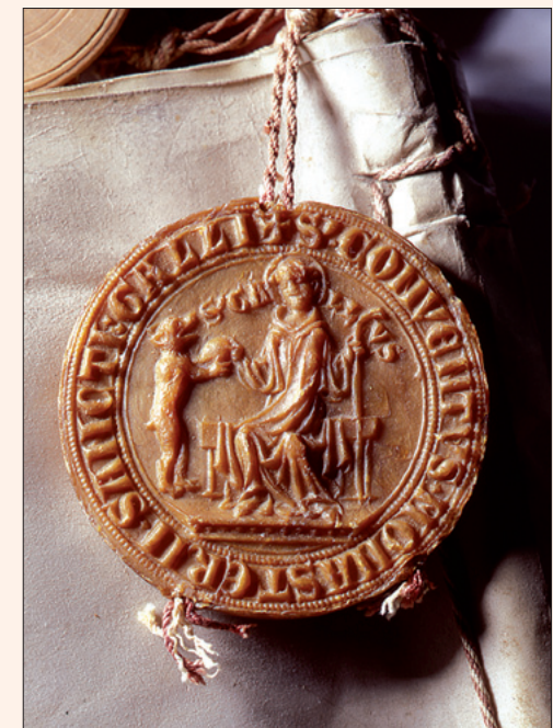
Das seit 1290 nachweisbare Konventsiegel zeigt den sitzenden heiligen Gallus mit Heiligenschein und Stab, wie er dem hilfreichen Bären ein Brot reicht.

Bis zur Französischen Revolution birgt das Stiftsarchiv für grosse Gebiete des heutigen Kantons St. Gallen und einige angrenzende Regionen den bedeutendsten Teil an historischen Quellen und Zeugnissen. Es erfüllt damit für diesen Zeitraum die Funktion eines Landesarchivs.